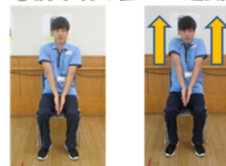
手の甲を合わせて手を伸ばします。手を伸ばしたまま肩を上げます。