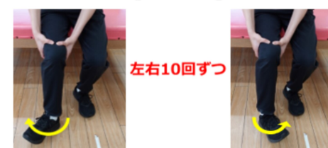
膝が動かないようにゆっくりと左右交互にひねります 左右10回ずつ