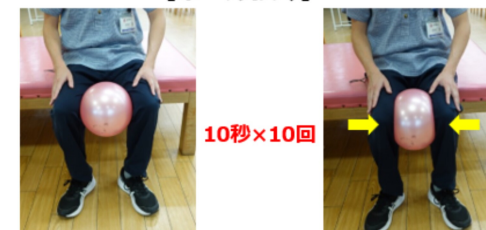
膝の間にボールを挟み、ボールをゆっくり潰していきます 10秒×10回