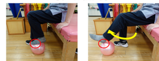
左右10回ずつ ボールが足から離れないように前後(つま先⇔かかと)に転がします