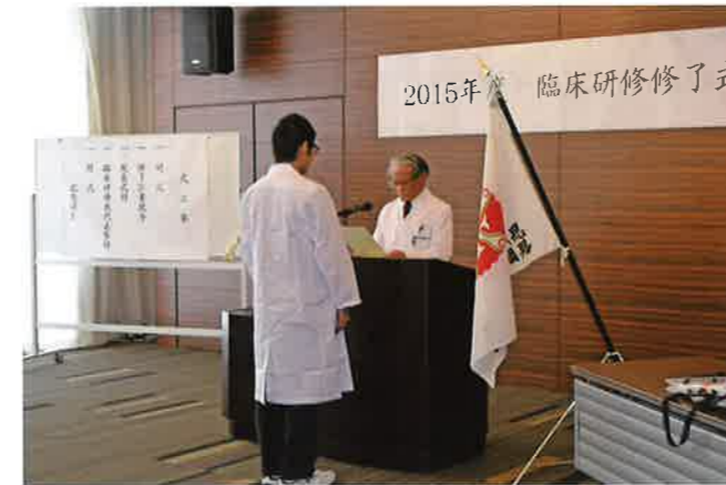
臨床研修修了式(熊本病院)