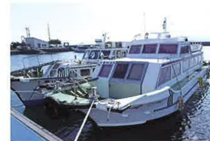
定期船で島へ(みすみ病院)