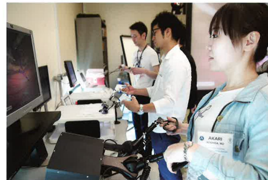
腹腔鏡手術のトレーニング