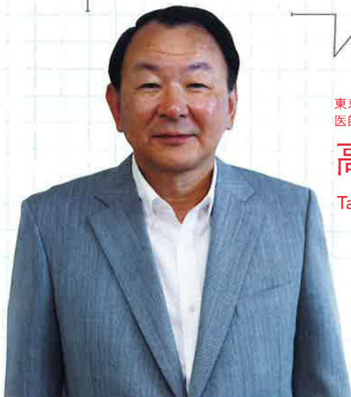
東京都済生会中央病院 病院長 医師臨床研修専門小委員会 小委員長

臨床研修指定病院協議会は、2014(平成26)年、法人全体として医学教育システムを運営するため、「医師臨床研修専門小委員会」に衣替えし(年表⑤)、これまでの研修をさらに強化・発展させながら運営しています。今後は新専門医制度への対応や本会での臨床研修をより良いものにするための改革を続けていく所存です。