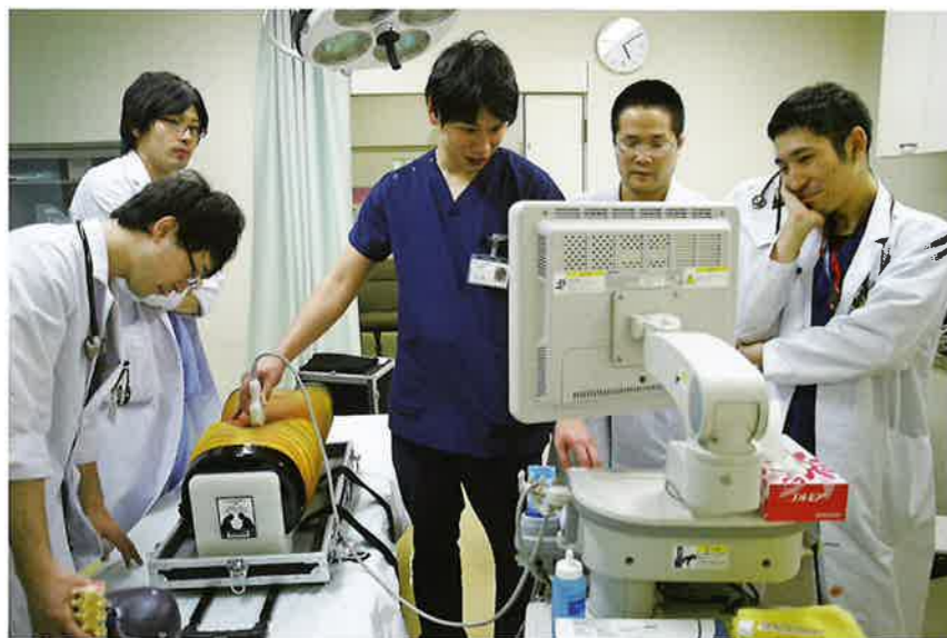
腹部超音波エコー(滋賀県病院)