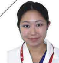
東京都済生会中央病院 後期研修医