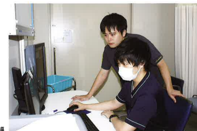
初期研修医への指導

救急医として、命を助けることはもちろん、その人の背景をも見て、最適な医療をすることを目指し、日々研修医の指導に当たっています。