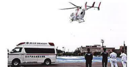
出動するヘリを見送る研修医