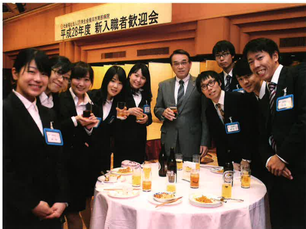
新入職者歓迎会(横浜市南部病院)