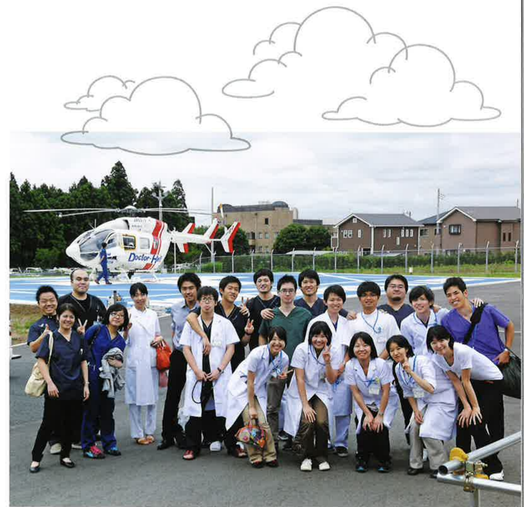
水戸済生会総合病院ドクターヘリの基地で、同院と山形済生病院の研修医が交流

社会人としても未熟で何もわからない状態でスタートした研修医でしたが、すべてのスタッフの方々に支えられ、楽しい2年間を過ごすことができました。研修医だからではなく、一人の医師として医療行為一つひとつに責任を感じながら行うことが、早く成長する術だと学びました。医療レベルだけでなく、人格としても尊敬できる先生にも出会うことができ、コメディカルの方との環境も含め、自信を持って後輩に勧められる研修生活でした。