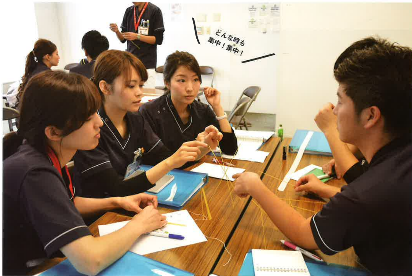
医療安全研修(中津病院)