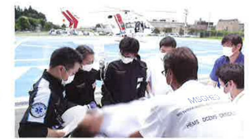
基地病院到着後、患者を救命救急センターに搬送