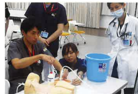
中心静脈カテーテルの穿刺(熊本病院)