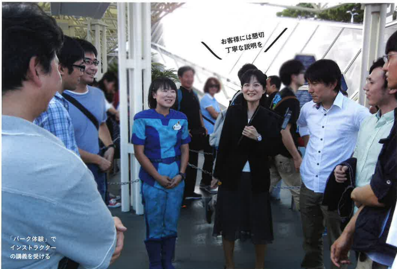
「パーク体験」で インストラクター の講義を受ける