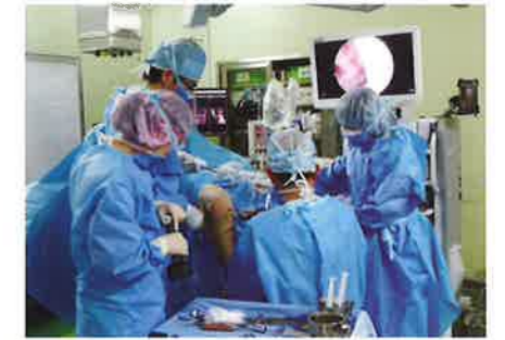
膝の関節鏡下手術の臨床教育(奈良病院)