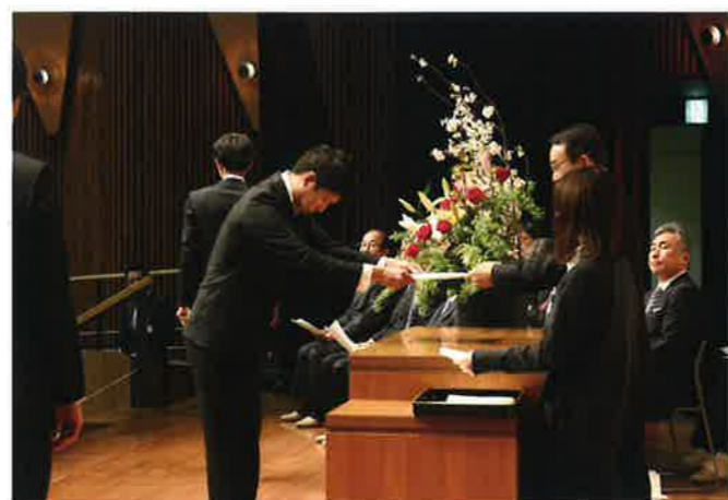
辞令を交付(横浜市南部病院)