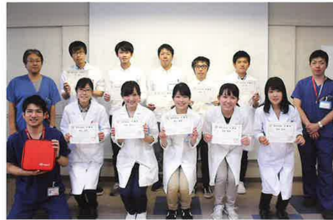
救命講習修了証取得(横浜市南部病院)

福井県済生会病院での研修医生活が始まって、早いもので1年が経ちました。その中で思う済生会の良さは、医局が研修医も含めて一同となっており、上級医や他科の先生方との接点が多く、診療科の垣根を越えた協体制が整っていることです。担当患者さんのことで悩んだ時には専門科の先生に気軽に相談でき、画像所見や治療方針についてもご指導いただけます。同様に院内スタッフも垣根なく、皆一体となったチーム医療を実感しています。仕事も人も素敵な出会いがきっとありますので、ぜひ見学に来て済生会の雰囲気を感じてみてください。