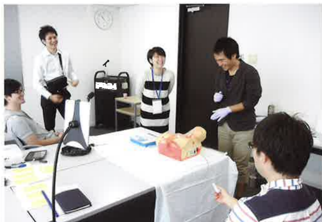
中心静脈カテーテルの指導法の研修