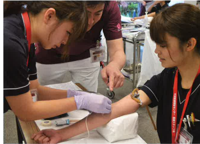
採血実習(中津病院)