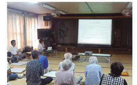
湯島の公民館で開催の住民健康講座(みすみ病院)