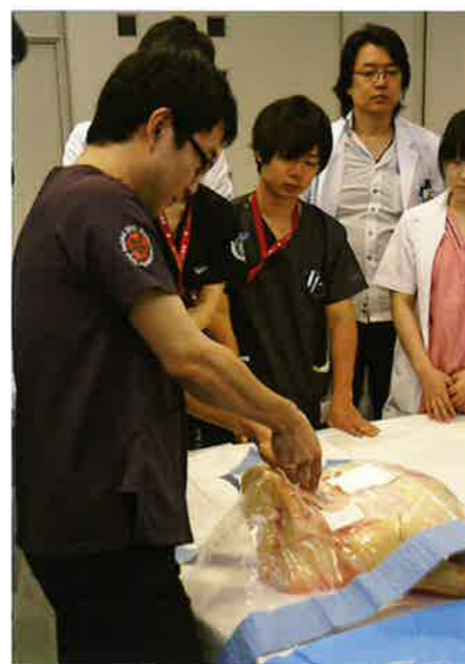
中心静脈カテーテル(滋賀県病院)