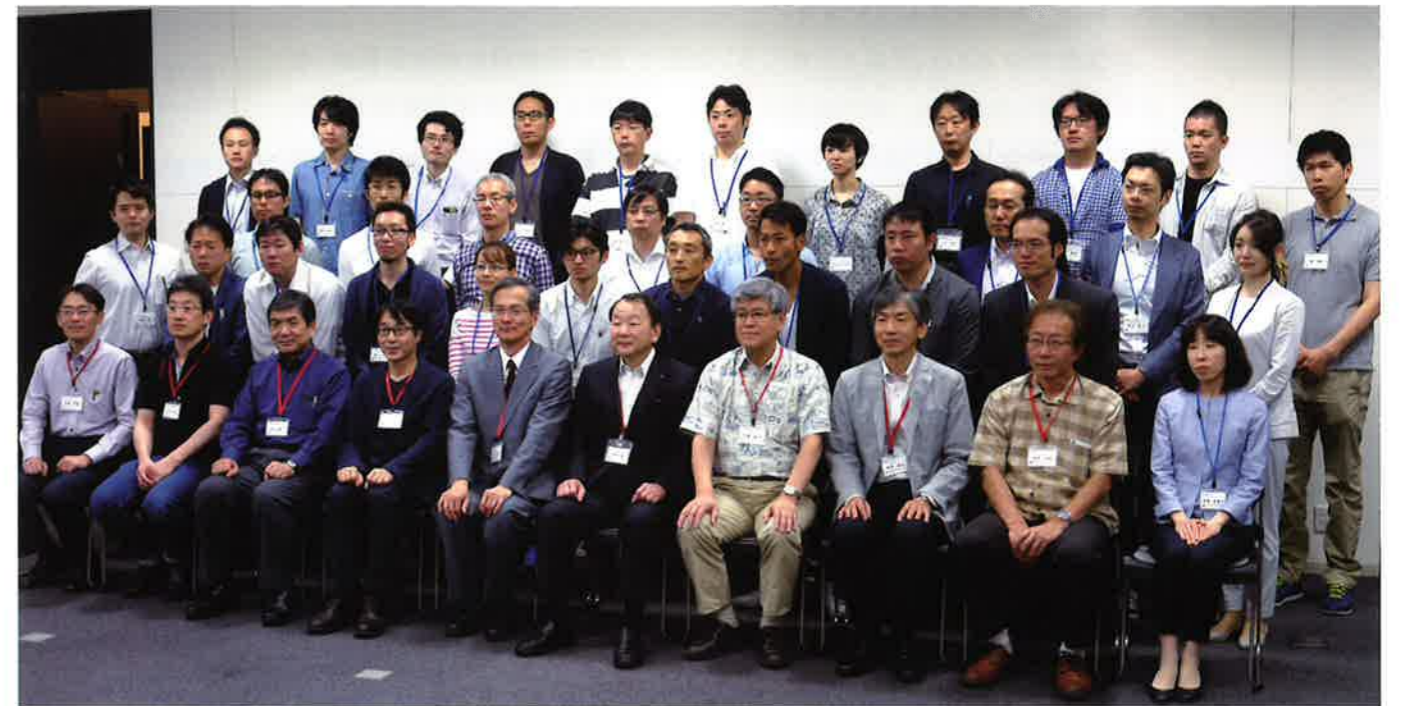
ワークショップ参加者全員で記念撮影