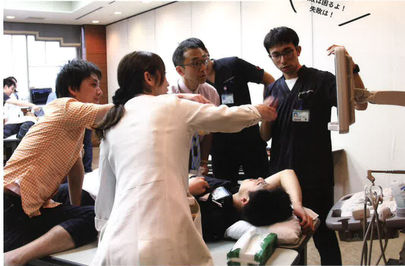
腹部エコーの指導(宇都宮病院)