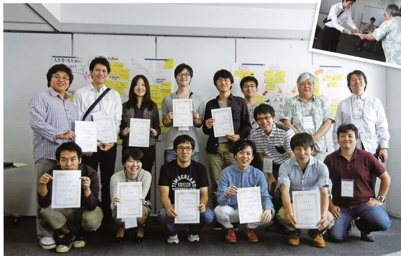
屋根瓦研修修了証取得