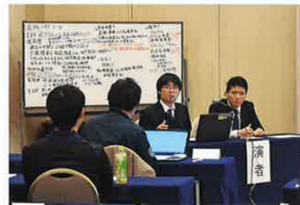
研修医育成セミナーでの症例発表(今治病院)