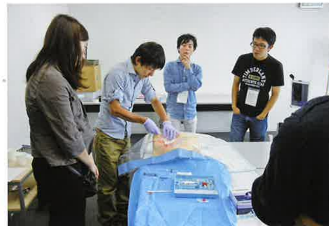
中心静脈カテーテルの指導法の研修