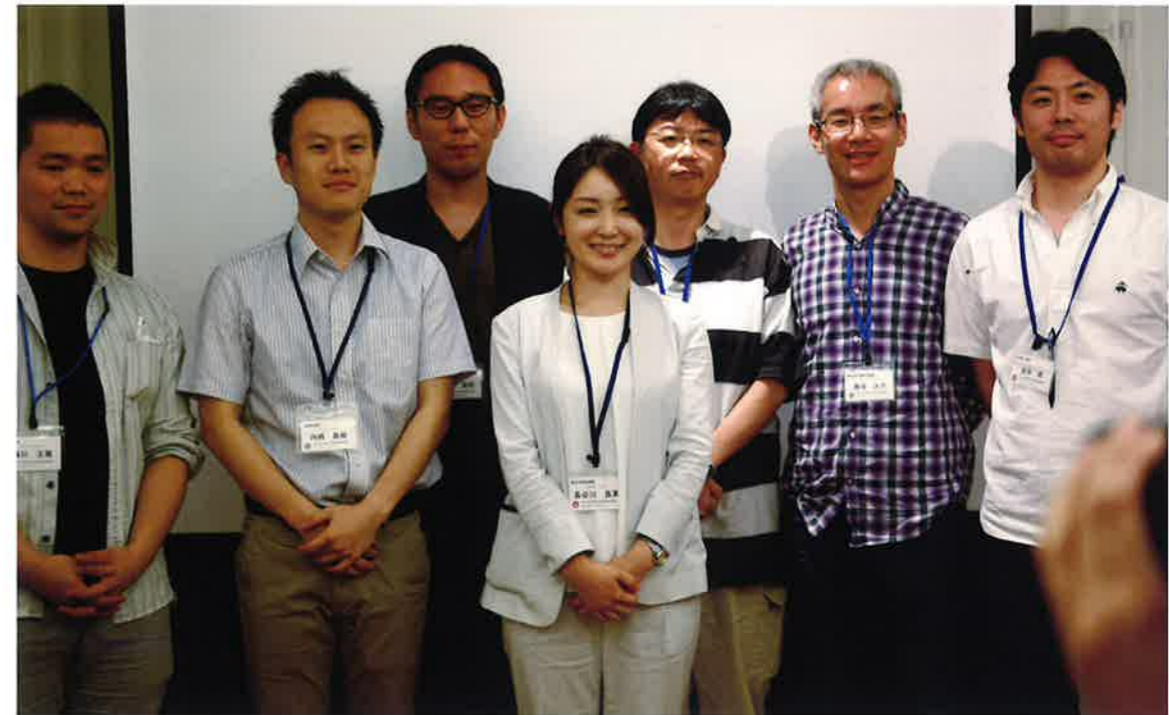
情報交換会でグループごとに記念撮影

医師の仕事は、患者さんを治すだけではありません。後輩を育てることも、大事な仕事です。そのため、後輩が受け入れやすいように、効率良く指導することも医師に必要なスキルだと思います。そういったスキルを身に付けるためにも指導医ワークショップは役立ちます。