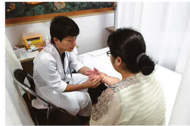
島の人たちを診察