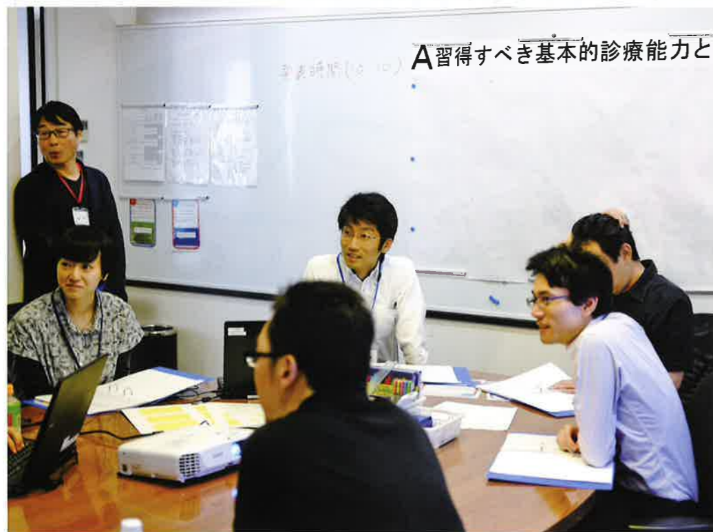
活発に議論をかわすグループ討議

指導医講習会修了者が、臨床現場で医師が抱えるさまざまな課題、知るべき医療現状を知り、全国の済生会職員とのグループワークを通して意見交換する「アドバンスコース」も実施しています。