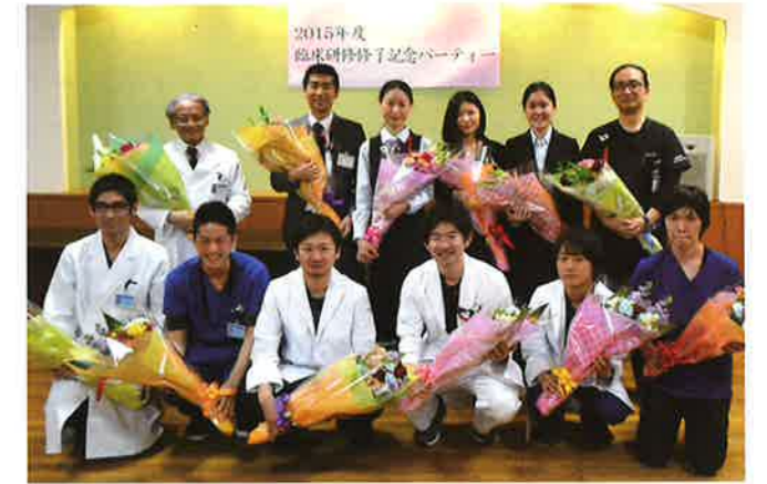
研修医からスタッフへサプライズで花束贈呈(熊本病院)