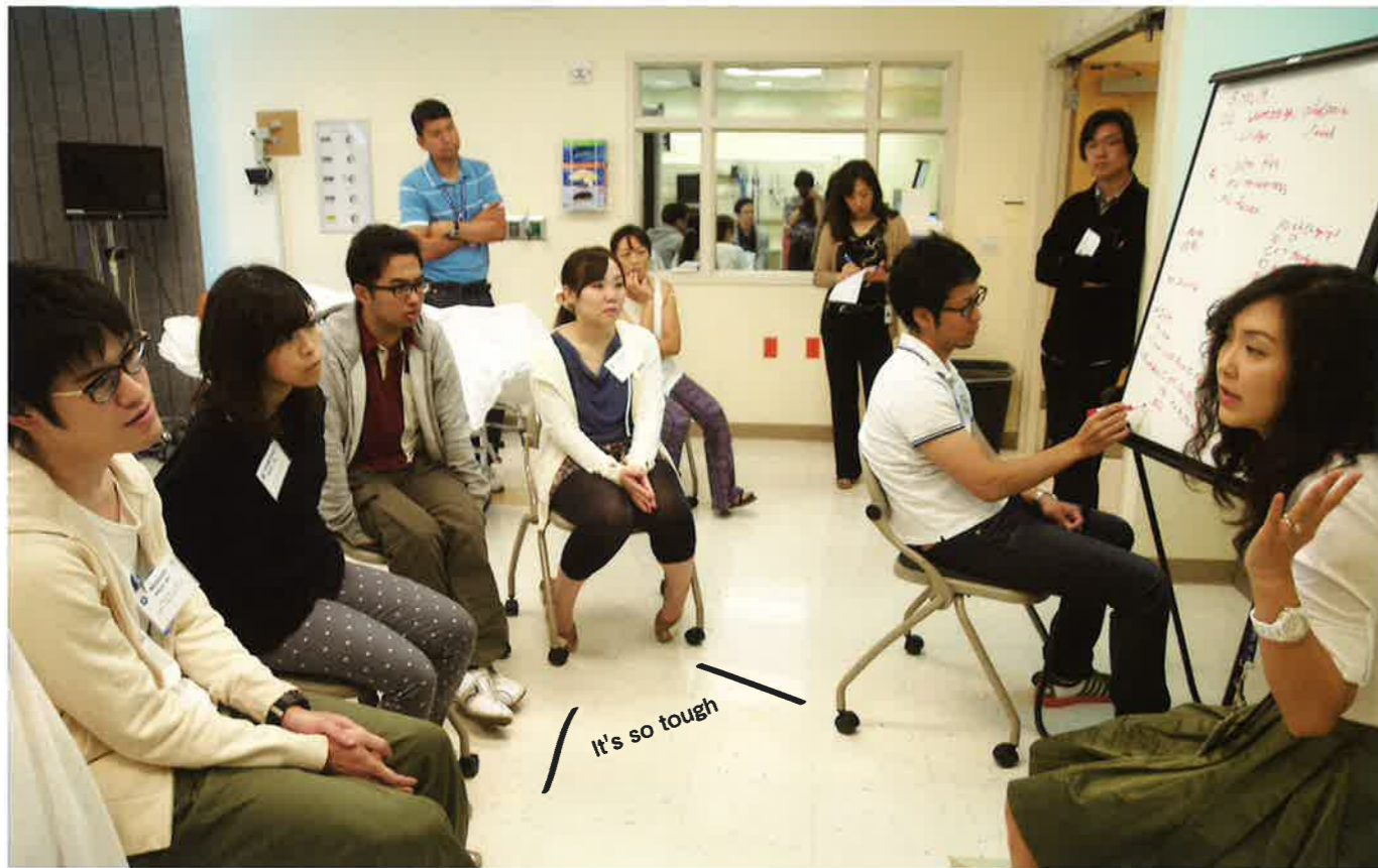
Pediatric Emergency のレクチャー