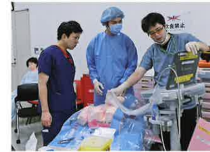
中心静脈カテーテルの研修(横浜市東部病院)