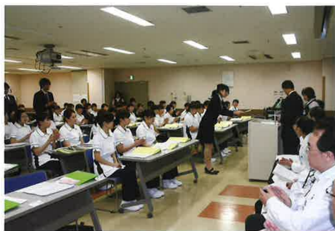
研修医も交えた全職員入職式(川口総合病院)

な研修です。初期研修の2年間は医師としての第一歩、しかしその経験はその後の医師人生を左右するくらい重要です。学生の皆さんには、見学・実習を通して研修の現場を実感し、挑戦する気概を持って、初期研修の場に飛び込んできてほしいと思います。さあ、ここからスタートだ!!