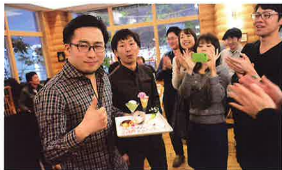
チーフレジデントへサプライズ誕生会(千里病院)