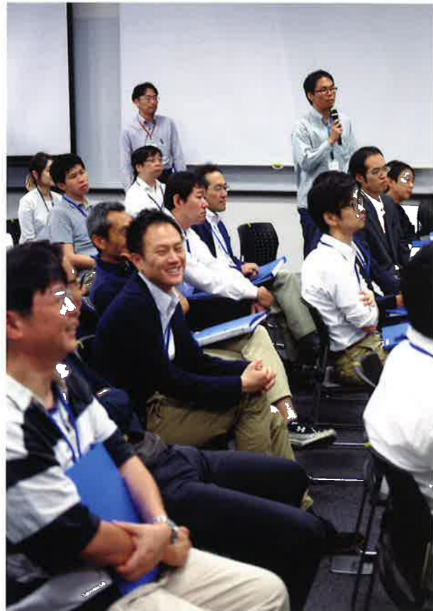
各グループの発表を聞く参加者

ワークショップ修了者には、済生会理事長と厚労省医政局長の公印が入った修了証書が発行されます。