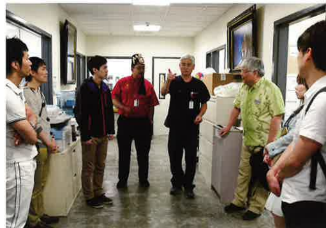
ハワイの病院見学