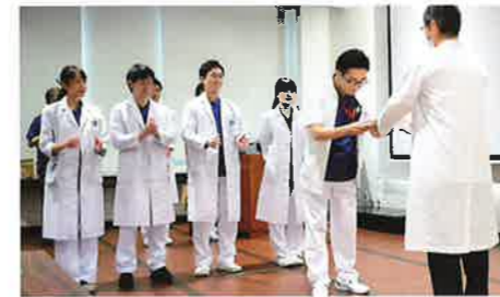
研修修了証授与(千里病院)