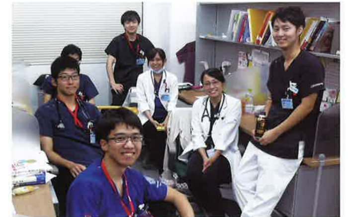
研究室でのひとときの休憩(熊本病院)