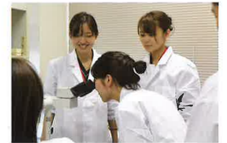
細菌検査実習(中津病院)