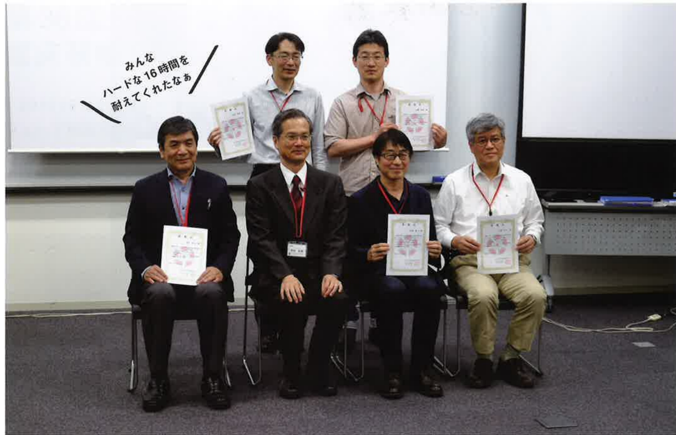
タスクフォースのメンバーに感謝状が贈られる