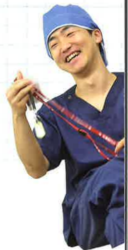
青年よ、大志を抱け!(山形済生病院)