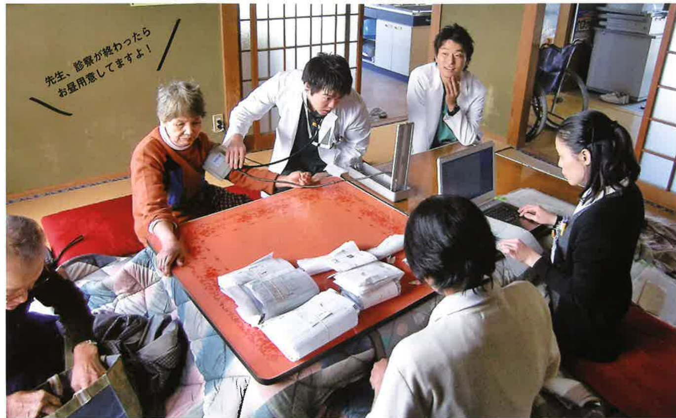
東京・中央病院、大阪・中津病院から大分・日田病院へ派遣。山間地の集会所で地域医療を学ぶ

「済生丸」(日本唯一の診療船)に乗船し、瀬戸内海や宇和海島嶼部で離島診療を経験します。研修スケジュールは、研修医の希望のもとに作成し、研修途中でも容易に変更することが可能です。研修をしていない診療科でも珍しい症例や手技がある場合には診療科の枠を越えて経験することができます。