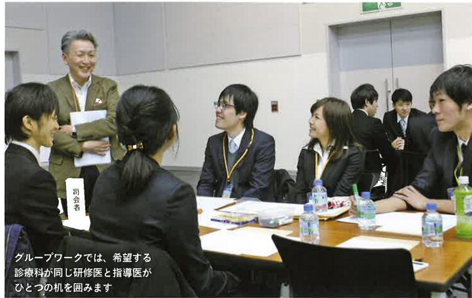
グループワークでは、希望する診療科が同じ研修医と指導医がひとつの机を囲みます