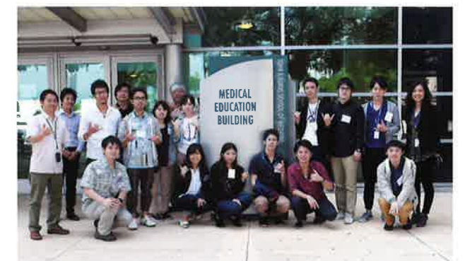
ハワイ大学医学部前で