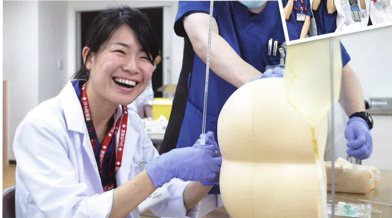
腰椎穿刺(千里病院)