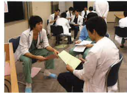
医療面接ワークショップ(中央病院)