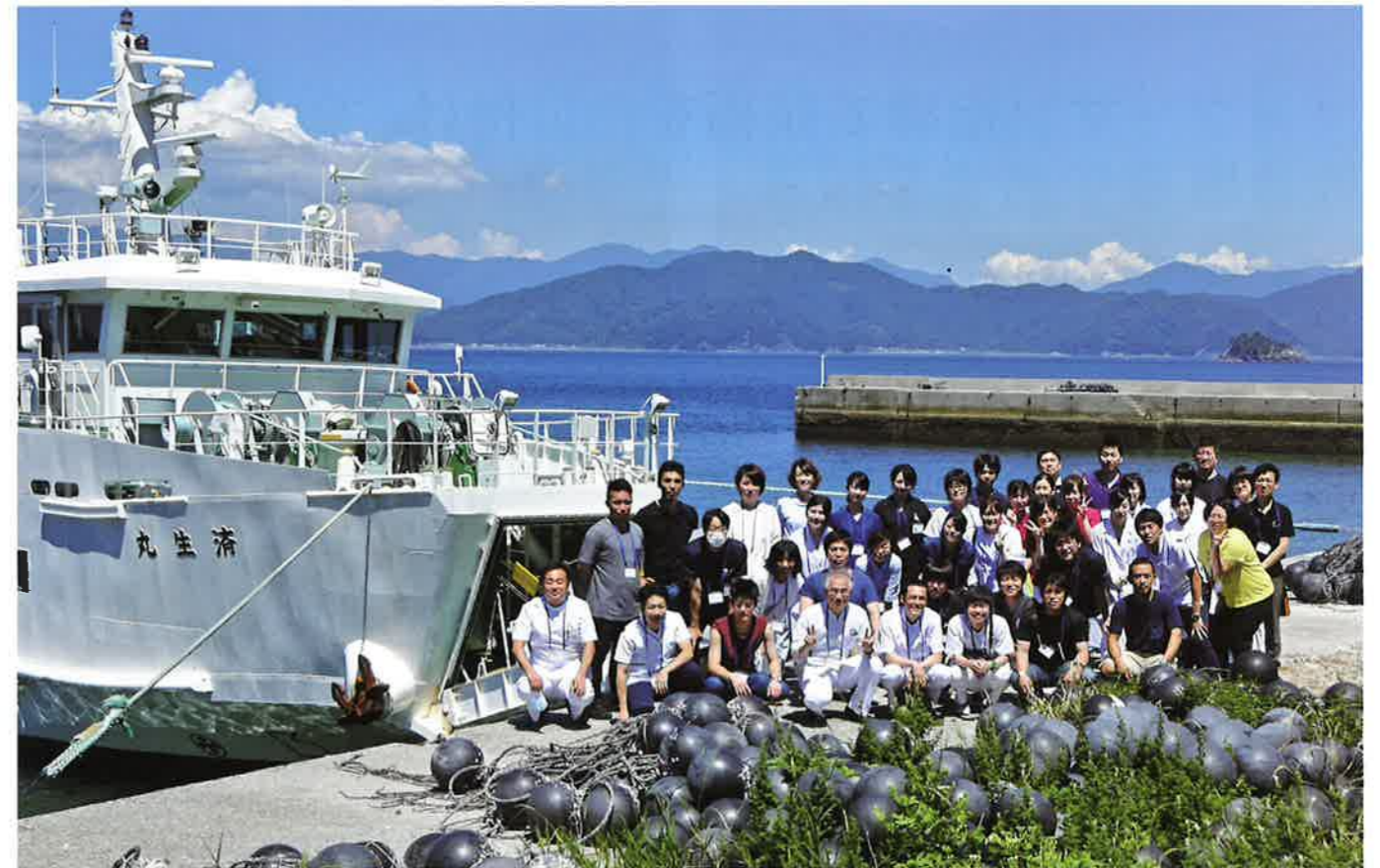
宇和海(瀬戸内海)合同健診。松山病院・今治病院・西条病院から研修医の他、医師、看護師、検査技師、事務員が参加