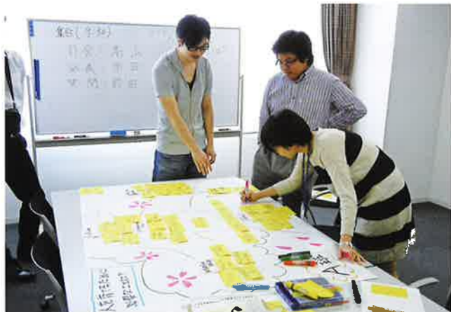
人材育成のグループワーク

カッションを行うことで洗い出し、『教え方のコツ』を学びます。このグループワークを通して後輩指導のスキルを学ぶことができます。