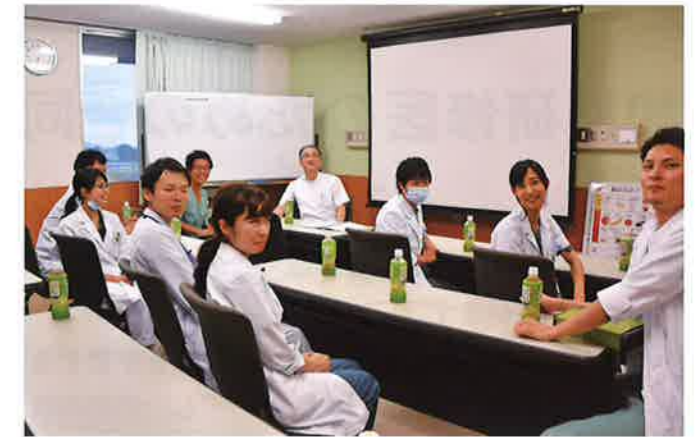
カンファレンス(新潟第二病院)