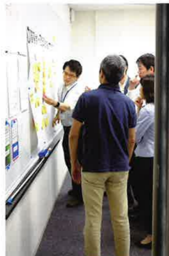
グループワークの討議のまとめをパネルを使って発表する