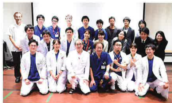
指導医とスタッフ一同(千里病院)