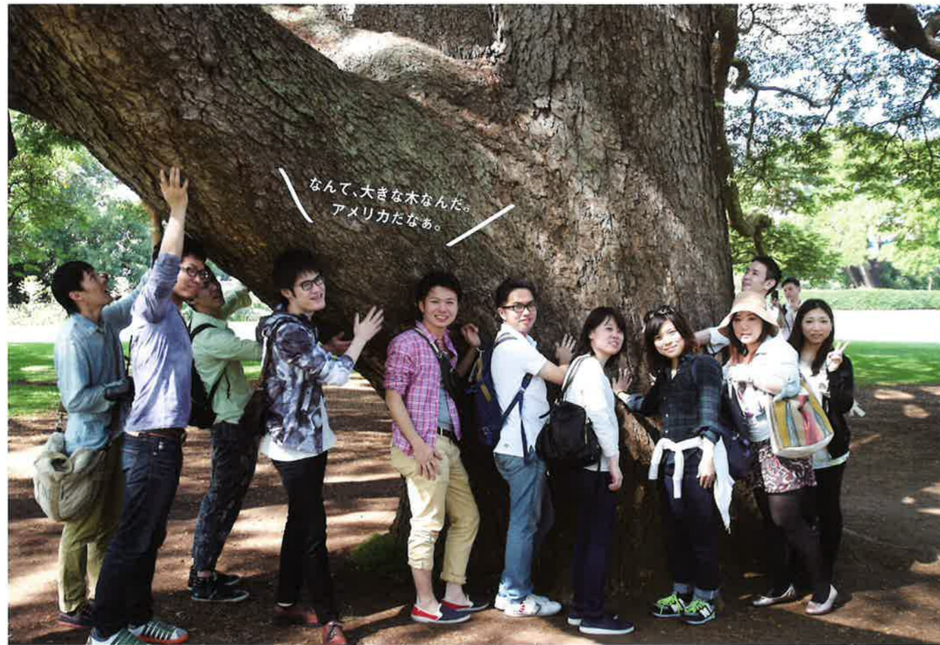
ハワイ研修参加者(モアナレア・ガーデンパーク)

を図ります。また、同年代の参加者のほか、ハワイ大学の教授や講師との交流を深め、参加者自身の医師の在り方の再確認と国際的な感覚や視野を身に付けてもらいます。