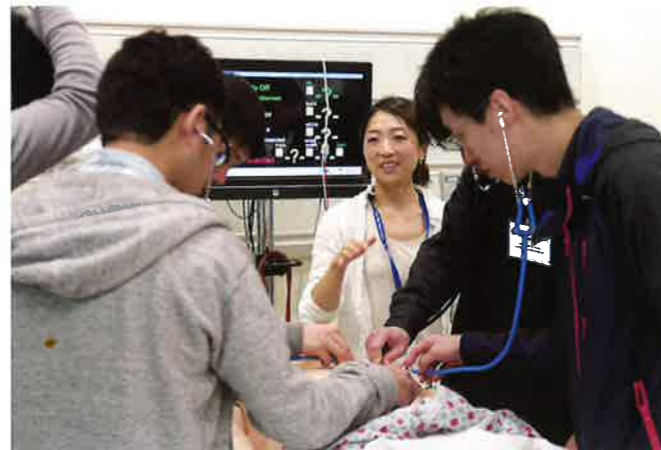
ハワイ大学 SimTiki (シミュレーションセンター)