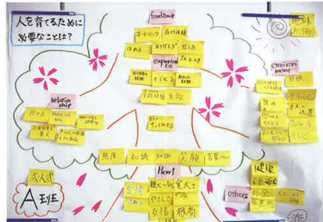
人材育成のグループワーク