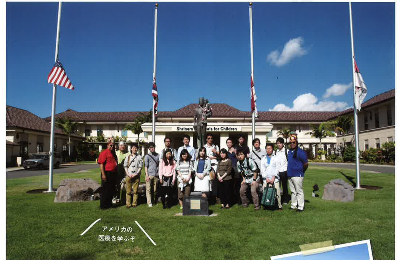
Shriners Hospital for Childrenを見学