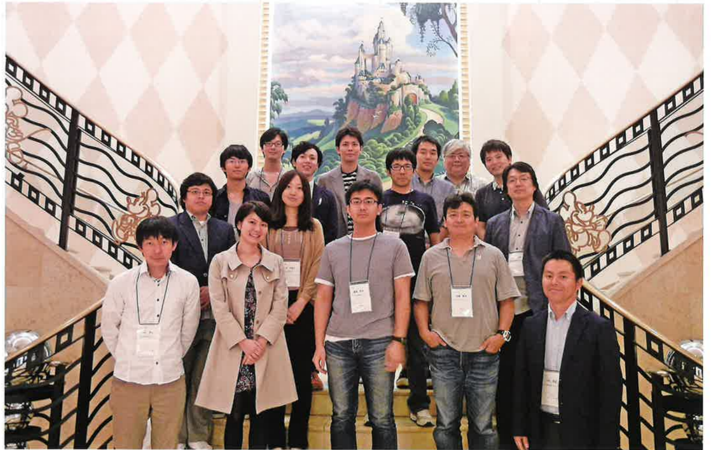
レクチャーを終えて参加者全員で